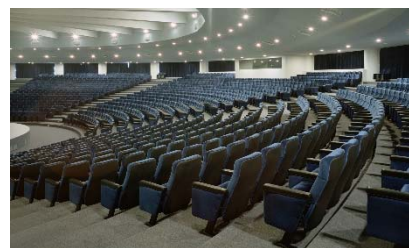
Exemplo de aplicação do MENTABACT